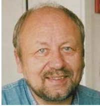
Roland W. Wagner Institut für Deutsche Sprache und Literatur und ihre Didaktik, Fakultät für Deutsch Pädagogische Hochschule Heidelberg